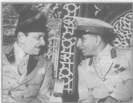
حديث هامس بين محمد نجيب وعلي ماهر باشا